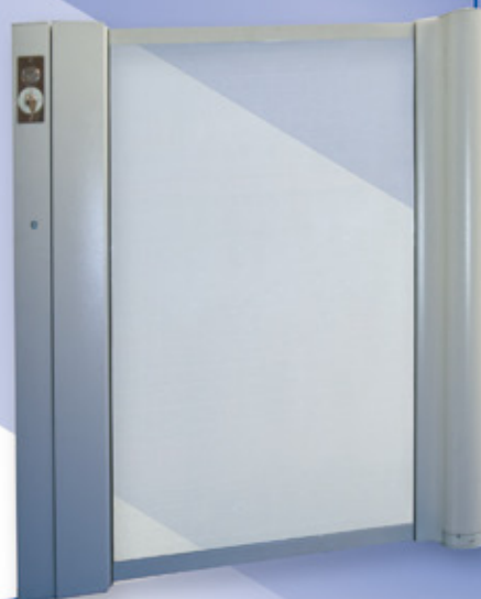
Vista de la puerta en la planta superior